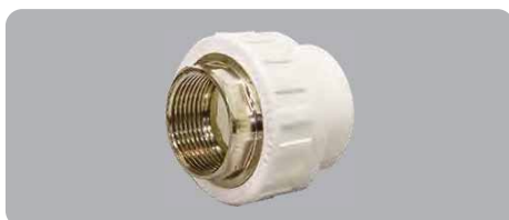
Муфта полипропиленовая комбинированная под ключ, внутренняя резьба