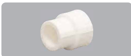
Муфта полипропиленовая переходная