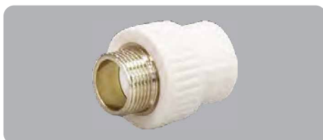
Муфта полипропиленовая комбинированная, наружная резьба