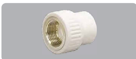
Муфта полипропиленовая комбинированная, внутренняя резьба